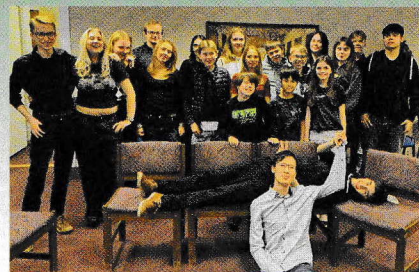
Några av deltagarna på höstens läger.

Ta chansen att ha ett skoj lov! Ett riksläger betyder vanligtvis lite sömn och mycket bridge spel kryddat med många skratt, lite galenskap och allmänna dråpligheter. Det blir helt säkert ett minne för livet!