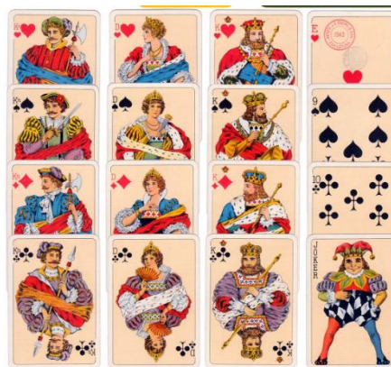
J.O. Öberg & Son