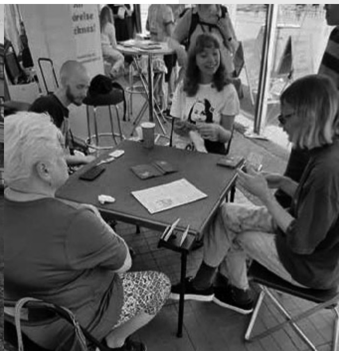
Från Frihamnsdagarna, Göteborg