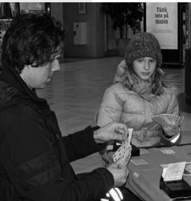
Från Valbo Köpcenter, Gävle

Att rekrytera nya bridgespelare till vår underbara värld kan vara en utmaning. För att rekrytera nya spelare måste vi alla hjälpas åt. Det handlar främst om att gemensamt planera och genomföra aktiviteter så att människor får reda på att vi finns i deras närhet – vi måste synas!