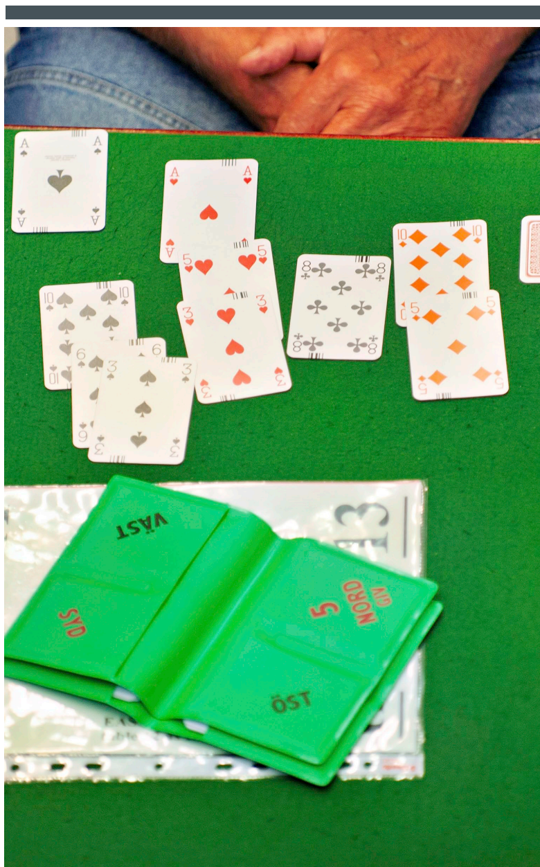
TIDIGARE OCH KOMMANDE TEMATRÄFFAR