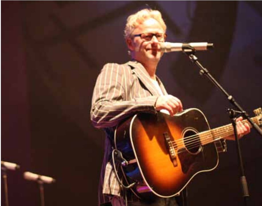
Uno Svenningsson bjöd på sin hitkavalkad vid Bridgefestivalens party.