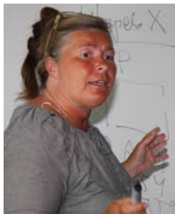
"Katt" – en av många duktiga seminarieledare.

Fem seminarier på lika många dagar arrangeras i ett av Scandic hotellets konferensrum. "Kursledare" är idel rutinerade spelare/lärare.