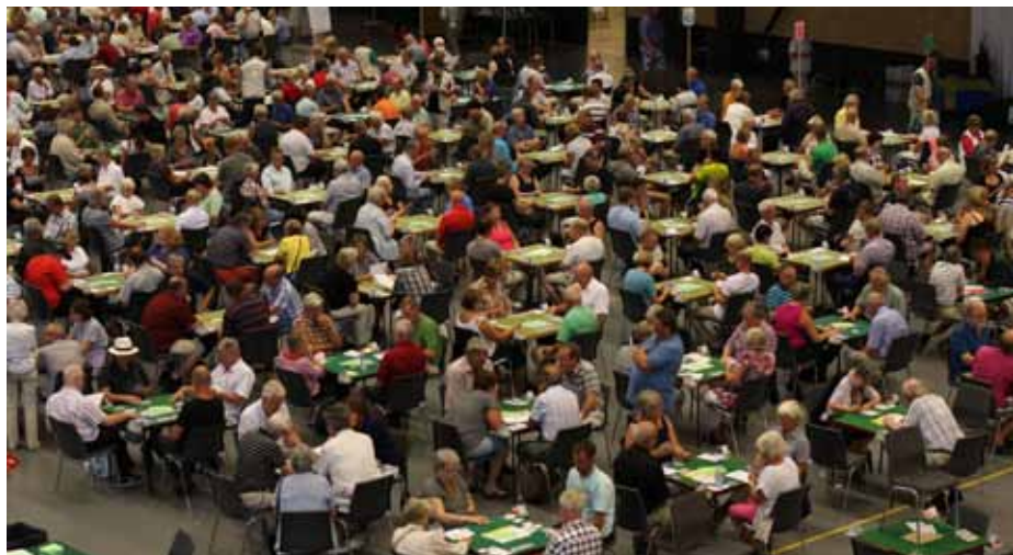
Fullt hus i Conventum Arena.